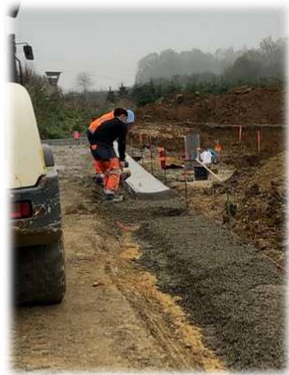
Pose des caniveaux