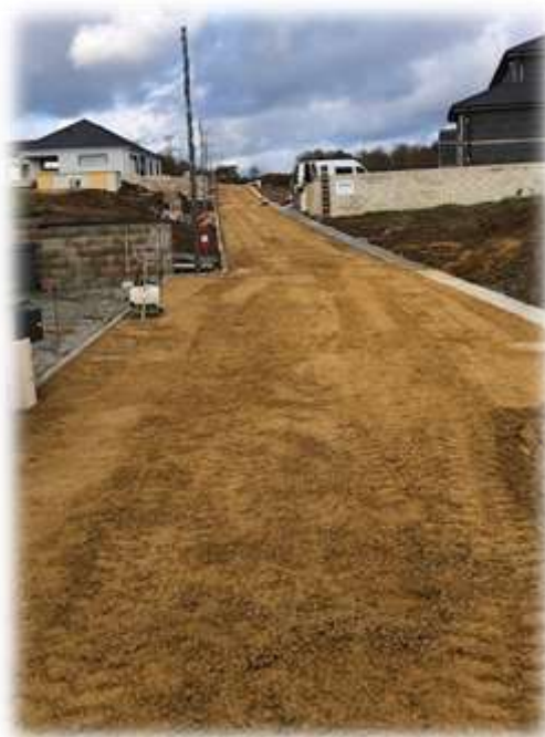
Réalisation de la structure de la voirie