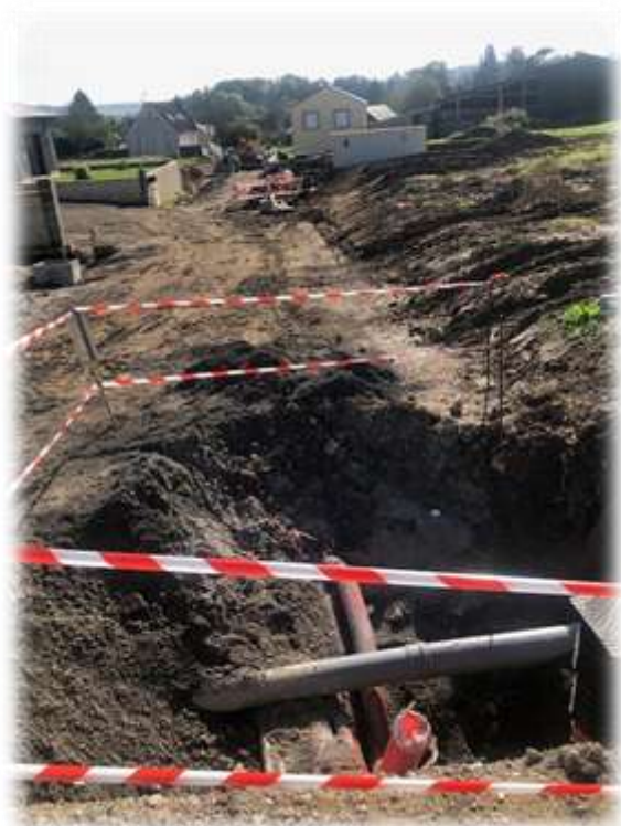
Pose des réseaux secs pour la fibre et l'électricité