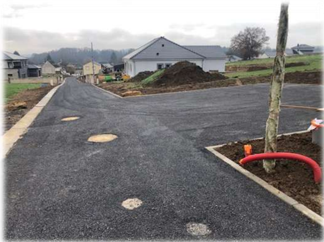
Pose de l'éclairage public