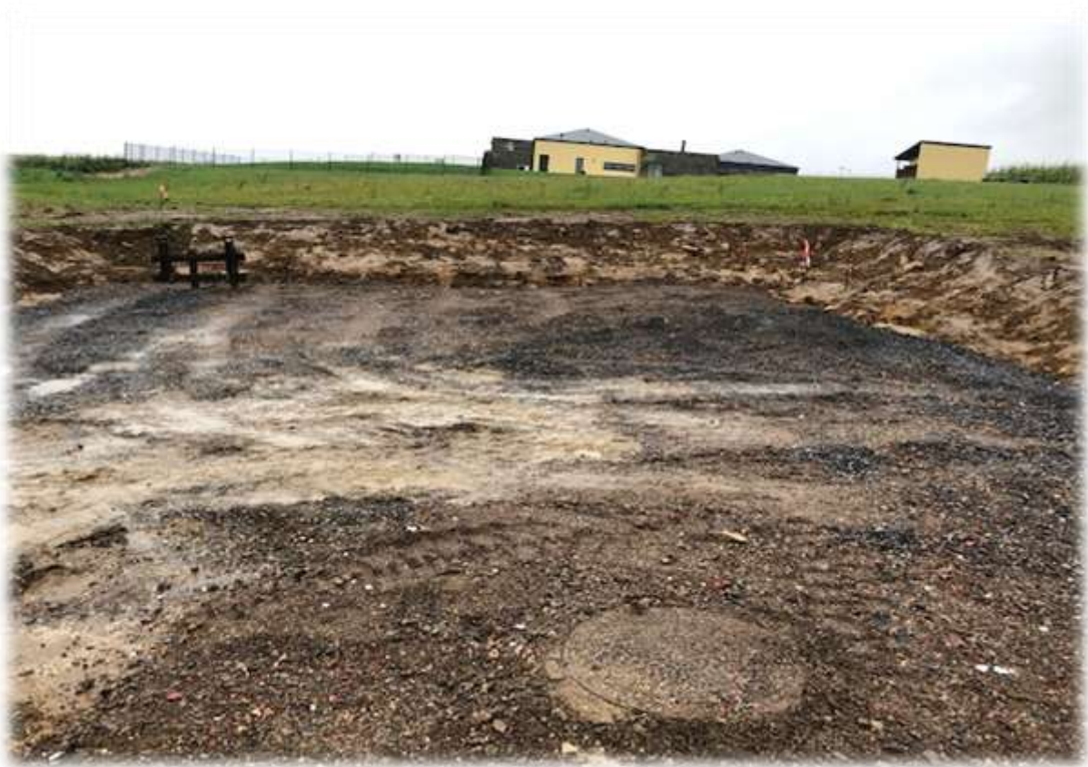
Création de l'aire de retournement dans la partie haute du chemin