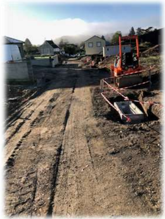
La structure de la route prend forme